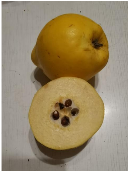
Фото 4 (ориг.)