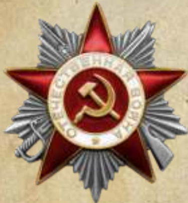
Орден Отечественной войны II степени