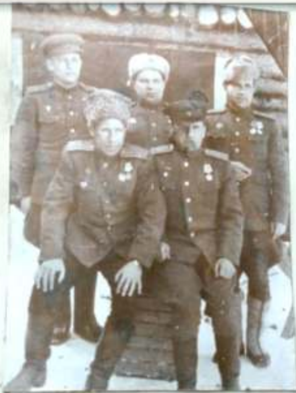
КОМСОСТАВ 1221 СТРЕЛКОВОГО ЮЛКА НОРВЕГИЯ. 15.04.1945 Г.

Гипотеза исследования: Можно предположить, что изучение боевого пути ветеранов Великой Отечественной войны методом создания сайтов способствует не только сохранению памяти прадедов, но и сохранению исторической памяти в целом.