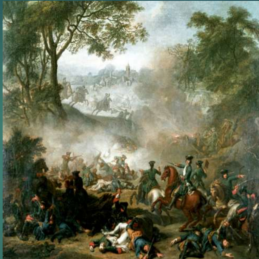
Битва при Лесной. Жан Марк Натье. 1717 г.

А.Д. Меншиков командовал авангардом корволанта в сражении у деревни Лесной. В этом сражении русские потеряли убитыми 1111 человек, ранеными 2856. Потери противников составили около 8000 убитыми и ранеными, множество солдат и офицеров попало в плен. Петр I назвал битву при Лесной "матерью Полтавской победы".