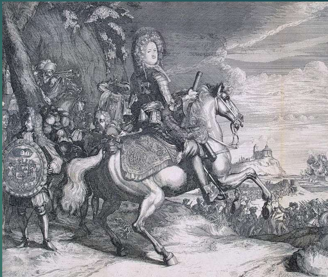
А.Д. Меншиков на фоне сражения при Калише. Гравюра П. Пикарта. 1707 г.

Калишское сражение стало первой крупной победой, выигранной русскими войсками в ходе Северной войны. Петр лично создал для Александра Даниловича награду – нарисовал эскиз дорогой трости, украшенной алмазами, изумрудами и гербом Меншикова.