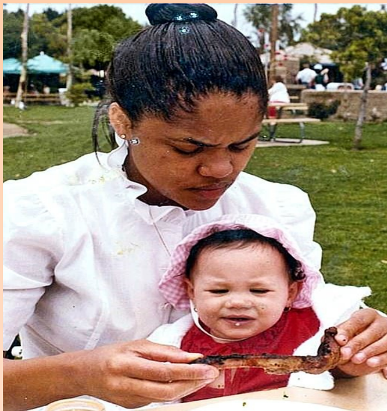
Меган с мамой Дорией.