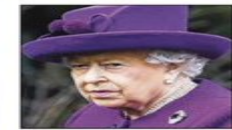
'Deeply upset' ... the Queen

By DAN WOOTTON, Executive Editor HARRY and Meghan last night announced they will be quitting as senior royals — leaving the Queen “deeply upset” and Charles and William “incandescent with rage”. The couple rushed out a bombshell statement — revealing they will split their time between the UK and North America — after their plans were revealed in the Sun yesterday. But the failure to consult other royals caused outrage. A senior source said: “Their statement was not cleared with anyone. It breaks all protocol. “This is a declaration of war on the family. There is fury over how they’ve done this.” Continued on Page Five