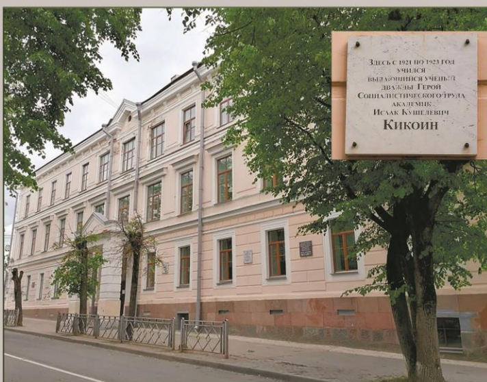
МБОУ СОШ №1 им. Л.М. Поземского г. Псков

Псковская средняя образовательная школа №1 старейшая в России, основана в 1786 году. У школы есть традиция собирать своих выпускников в первую субботу октября. Так было и в 1966 году. Школа праздновала свое 180-летие. Многие из здравствующих выпускников прибыли на торжество. Это было значимое событие не только для школы, но и для города. Школьный актовый зал не мог вместить всех желающих.